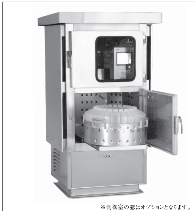
※制御室の窓はオプションとなります。